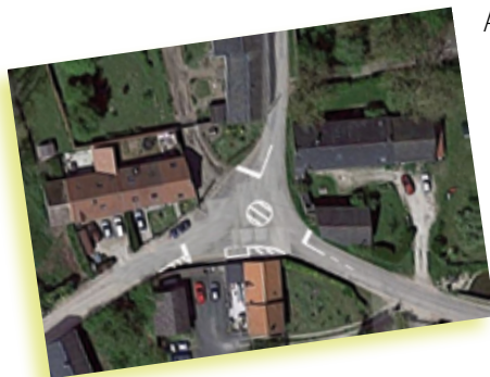
flours dans le milieu de Cernay en venant

Après la mise en place de cette signalisation, la commission travaux effectuera de nouveaux relevés qui seront comparé aux premiers.